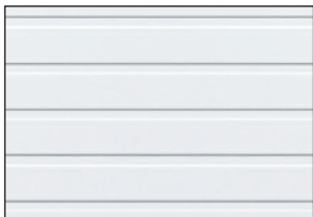
Blanc glacier avec rainures