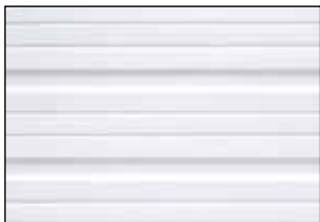
Blanc glacier avec rainures